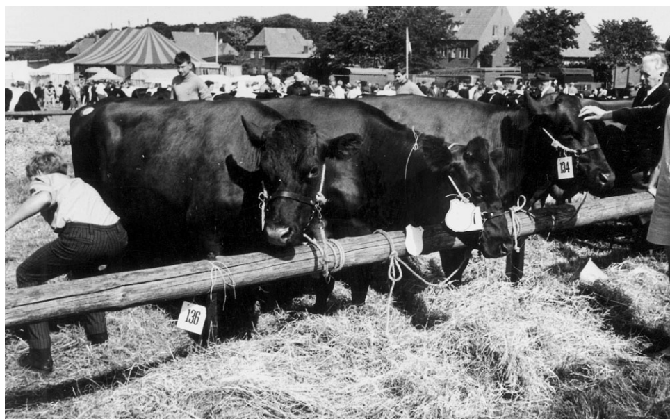
Dyrskue i Thisted i begyndelsen af 1970'erne.

indbyrdes konkurrence føre til en anden landbokultur?