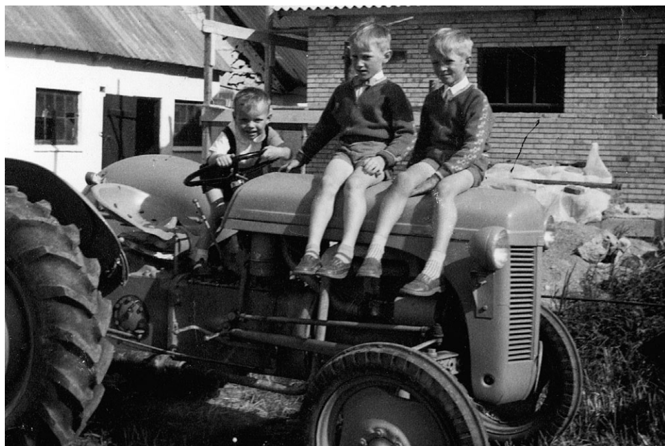
Ferguson-traktoren fik stor betydning for landbruget – og en stor plads i landbodrengenes bevidsthed. Det fremgår tydeligt af dette billede fra begyndelsen af 1960'erne.

gen. De, der blev tilbage og som er i stand til at leve op til disse krav, kan glæde sig over at leve i det åbne land i pagt med husdyrene og naturen.