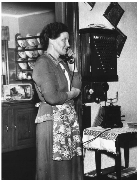
I stuen hos bestyrerinden af Lyngby Central kort før nedlæggelsen.

telefonen, siden i mobiltelefonen. Der var engang en anden snakkekultur og i en nu næsten glemt verden, hvor tempoet også var et andet. Det var dengang, man for det første skulle dreje med et håndtag, hvorefter der var en kvindelig stemme i røret: »Centralen!«. Eller: »Thisted!«. Så forlangte man det ønskede nummer, og hvis det var optaget, fik man en melding tilbage om – ja, at det var optaget! Det var telefontider. Hvis man kendte damen på landcentralen eller en af de mange, der sad i telefonhuset på hjørnet af Dragsbækvej og Tordenskjoldsgade (i dag Missionsforbundet), så kunne man komme i de privilegerede rækker. Det var de abonnenter, der ikke altid var nødt til ligefrem at ønske et nummer, men for hvem det var tilstrækkeligt blot at sige ned i telefonrøret: »Gi' mig lige Arbejderforeningen, så er De sød!«.