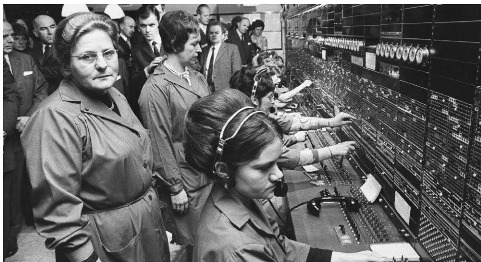
Så er det nu! Sidste forbindelse afbrydes.