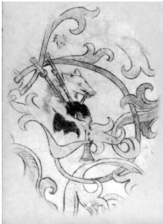
Forsidebilledet til årgang 1999.

(Kilde: Historisk Årbog for Thy og Vester Hanherred 1999, side 7-8).