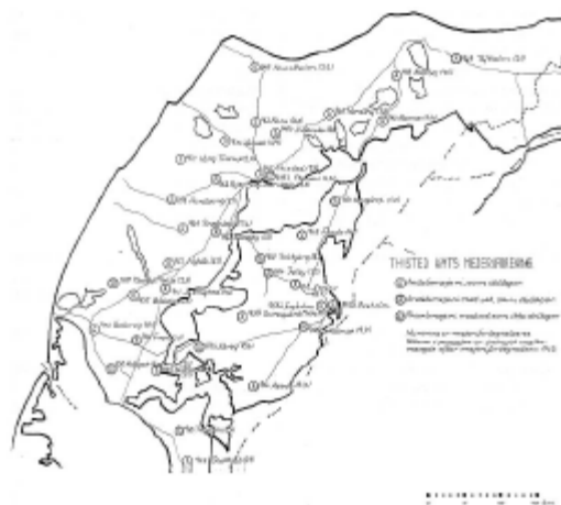
Mejerier i 1963.

Det vedtoges at nedsætte et udvalg bestående af de 6 mejeriers formænd og mejeribestyrere. Dette udvalg holdt møde 21. juni, og her valgtes jeg til formand for udvalget. Det vedtoges at indkalde til orienterende møder i de 6 mejerikredse.