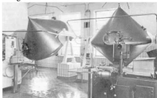
Interiør fra Sjørring mejeri.

I året 1950 var ca. 21% af den danske erhvervsbefolkning beskæftiget i landbruget. Det var 4 år efter, at jeg begyndte som selvstændig. Men den tekniske udvikling, som rigtig tog fart efter 2. verdenskrig, betød mange arbejdspladser uden for landbruget. De nye arbejdspladser lokkede mange landmænd ind til byerne, for det var jo her, fabrikkerne lå. Landbruget havde ikke let ved at konkurrere med