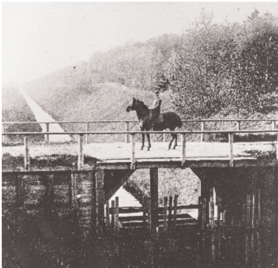
Slusebroen ved Egebaksande.