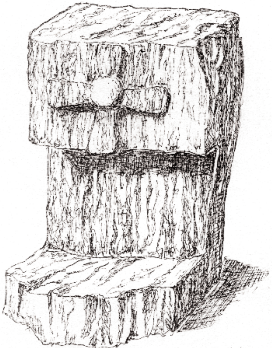
Granitsten med Stägstrups kirkte. April 96