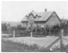
Hundborg lægebolig 1904 inden haven voksede op.