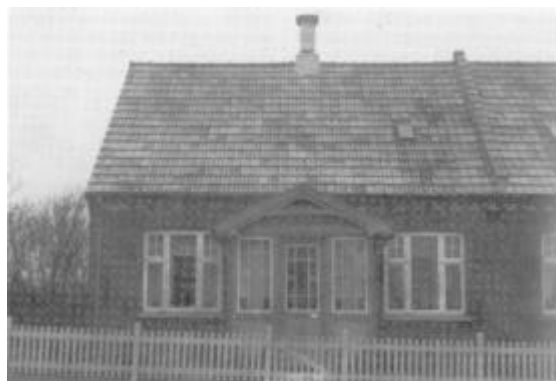
Hundborg Gæstehjem, i dag Vorupørvej 198.