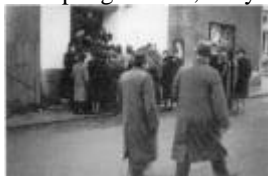
Kø foran Palæ-Teatret.