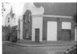
Kun kirken er tilbage.