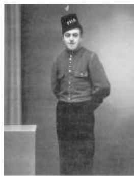
Biografpiccoloen Herluf i Palæ-Teatrets uniform.

skabte filmhistorie, tænkte han ikke på, men at filmen er kommet på Filmmuseet, det er ganske vist.