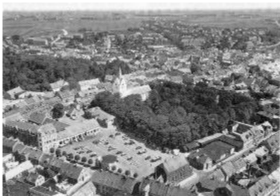
Lufbfoto af Thisted, 1955.

1950'erne havde ikke blot i Thisted, men overalt i Danmark stået i bolignødens tegn. Besættelsestiden havde medført en kraftig opbremsning i boligbyggeriet, og manglende privat investeringslyst, kombineret med knaphed på materialer og faglært arbejdskraft - især murere - gjorde det vanskeligt at få byggesektoren i gang igen. Og hamle op med det samtidige "baby-boom" kunne man slet ikke.