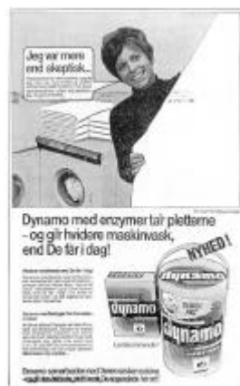
Dynamo. Annonce i TD 1.10.1970

Høj rente, lav inflation og stram familieøkonomi betød en kraftig opbremsning af parcelhusbyggeriet i 80erne. De nybyggede huse blev mindre, og andelsboligen - nu oftest i rækkehusudgave - fik en renaissance. En grøn bølge gik gennem kvartererne; der blev klistret havestue på hvert andet hus, og store grønne planter - næsten som klunketidens viftopalmer - bredte sig ind i stuerne. Tunge lædermøbler symboliserede velstand, men modens nøgleord var mangfoldighed. Funktionalismens blanke stål