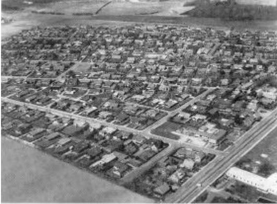
Luftfoto af Thisted i 1980. Parcelhuse vest for Simons Bakke

side. Det er solidt murstensbyggeri, oftest efter den fremherskende ”bedre-bygge-skik”-model. De rummelige haver var ikke blot til pynt, men skulle med høns, frugt og grøntsager bidrage aktivt til husholdningsbudgettet.