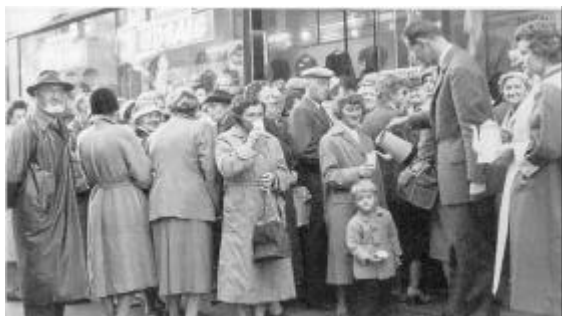
Mens man venter på bedre tider. Forventningens glæde stimuleres foran Peter Jensens Manufakturhandel i Vestergade. 1.10.1959.

Stuen er en ø af lys og varme i mange tusinde aftener, hvor vi alle fire altid er inde i den som papdukkerne oppe på væggen er inde bag søjlerne i det dukketeater, min far har lavet efter en model i Familie Journalen. Det er altid vinter, og ude i verden er det iskoldt ligesom i sovekammeret og køkkenet. Stuen sejler gennem tid og rum, og ilden buldrer i kakkellovnen. (Tove Ditlevsen: Barndom, 1967, s. 12)