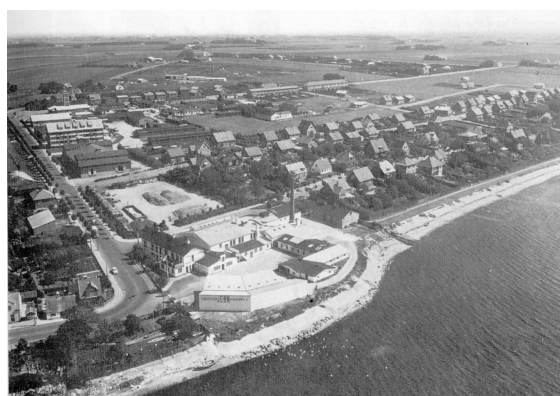
Luffoto af Thisted 1955.

Og så var der dem, der boede udenfor byen - uden dog at være landboere af den