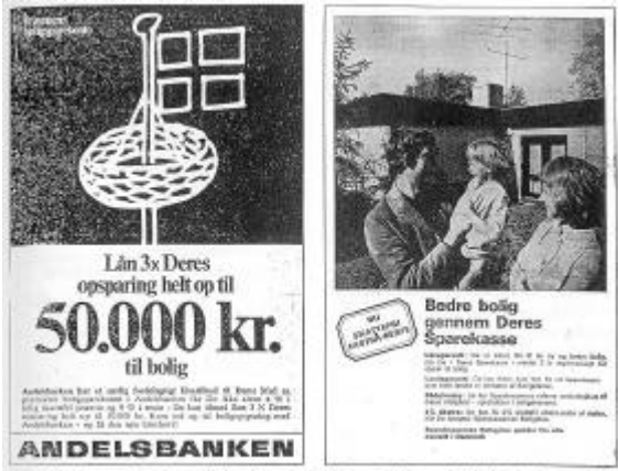
At trække fra er også at lægge til. En skattet logik i 70erne. (Reklamer for Andelsbanken og for et sommerhus. Hhv. T.D. 1. og 2.10.1970.

boligstandard. Boligstatistikken viser, hvordan antallet af værelser pr. bolig voksede. Det var først og fremmest antallet af boliger med 3-5 værelser, der voksede. Samtidig blev det nye parcelhus - set på 50ernes baggrund - et slaraffenland af sanitære installationer med bryggers og fuldautomatisk vaskemaskine, rummeligt badeværelse og gæstetoilet.