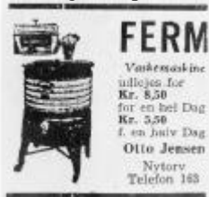
Ferm Vaskemaskine. Thisted Amtstidende 2.10.1950

Der er langt i tid og rum fra Tove Ditlevsens Vesterbro-barndom i begyndelsen af 1920'erne til et arbejderhjem i Thisted i 1950. Men særdeles mange - nu midaldrende - der var børn i halvtredserne, kan nikke genkendende: erindringer er præcis. Sådan var det!