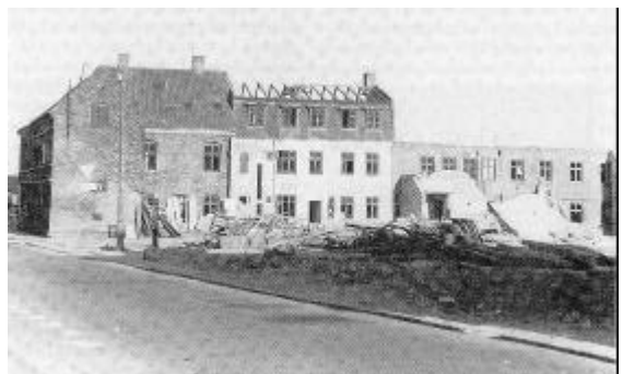
Det er ikke borgerkrig, men sanering i Thisted 1966. Bagsiden af Gasværksvej 2-4-6 - nu Kystvejen - set fra Toldbodgade.