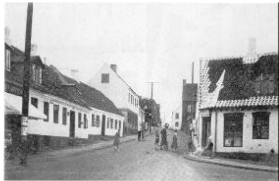
Østerbakken før "fremskridtet" tog fart. Fotografi 1960.

Af og til truede boligtilsynskommis sionen med forbud mod beboelse af bestemte lejligheder, men kun sjældent blev truslen realiseret. Man kunne jo ikke lade de pågældende familier stå på gaden.