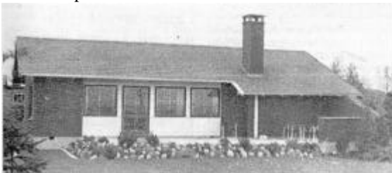
Drømmehuset 1960. Familie-Journalen juli 1960.

I 1945 mente byplanlæggerne, at den form for bebyggelse hørte fortiden til. Bolignøden skulle afskaffes gennem det effektive, gerne industrialiserede sociale byggeri. Men ved den store boliglovgivning i 1945 havde politikerne alligevel rakt en lillefinger til kommende parcelhusejere. Man besluttede at yde statslån til individuelt byggeri for at sikre ”den mindrebemidlede del af befolkningen, fortrinsvis familier med børn” adgang til at erhverve eget hus. Ved at lægge lavt loft over håndværkerudgifterne sikrede man sig en passende beskedenhed i udførelsen. De fleste statslånhuse fra 50’erne er på ca. 80 kvadratmeter.