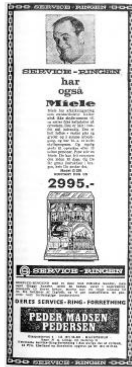
Opvaskemaskinen Miele. (Annonce i TD 1.10.1970).

I 60erne ville man gerne demonstrere afstand til det gamle. Man eksperimenterede med materialerne og var ikke bange for at slippe mursten og tegltag. Måske dristede man sig endda til fladt tag. De nye termoruder gjorde det muligt at øge vinduesfladerne