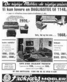
Frøkjær Møbler. T.D. 2.10.1970.

Det gamle borgerlige ideal om såvel spisestue som dagligstue glemte man alt om. Den nye stue var det hele, men især op gennem 70erne begyndte den at tabe terræn til køkkenet. Det begyndte at udvikle sig til familiens centrale "alrum", ofte i et integreret fællesskab med stuen. Samtidig blev