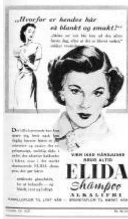
Husmoderens drøm når dagens arbejde med stovvask, stryging, stopning og syning er afsluttet. Reklame i Hjemmet, januar 1950.

Skal vi have det hele med, er der også vaskekælderen, hvor mor holder vaske-dag med dampende kogevask og skyllevand en gang i måneden. Måske er hun blevet aflastet af én af de nye "Fern"-vaskemaskiner, man nu kan leje.