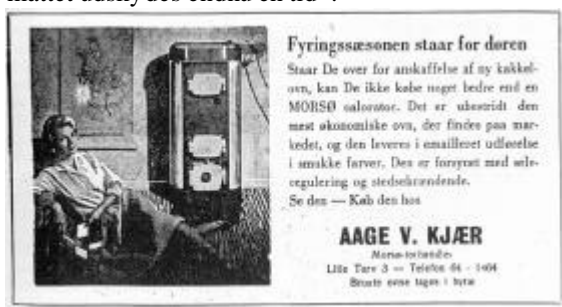
Thisted Amtstidende 4.10.1960.