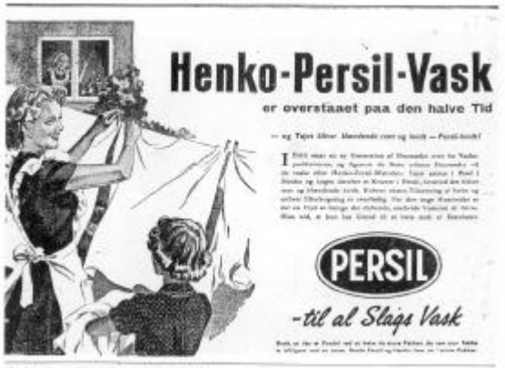
Henko-Persil. Thisted Amtstidende 4.10.1950.

glæde sig til et varmt bad med skum - som man kendte det fra Hollywood-filmene. I 1960 var det kun en tredjedel af boligerne - 1134 - der rummede denne luksus, men de andre har formentlig fortsat klaret sig med etagevask i køkkenet og måske en balje med varmt vand om lørdagen. Men i 1965 havde yderligere 800 fået installeret badeværelse og i 1970 havde to tredjedele af boligerne - 2.751 - eget bad.