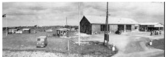
Motorfolket etablerer sig. 50'ere fritid og bilisme. Jørgensens Auto på Aalborgvej i 50'erne.

I begyndelsen af 60erne begyndte der at ske noget. I 1962 blev et antal huse ved Østerbakken ofre for den hastigt voksende bilisme; der skulle være plads til den gennemgående trafik mod Aalborg.