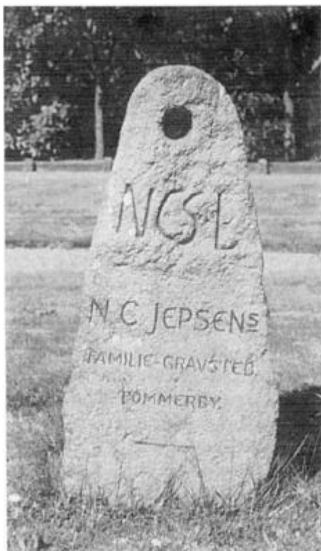
Bindestenen på kirkegården i Tømmerby.