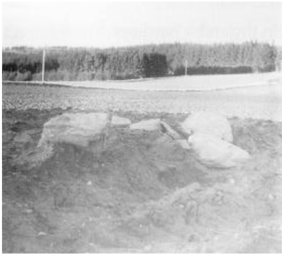
Fig. 1: Før udgravningen – en samling store, flade sten på marken.

I forbindelse med den store omlægning af landbruget, der begyndte i slutningen af 1700-tallet, måtte mange fortidsminder bukke under for kravet om mere landbrugsjord, og en dag kom turen til den nordligste af de to høje. Den blev indlemmet i marken, mens den sydligste høj fik lov at blive liggende. Måske var den med sine 18 m i diameter og 4 m i højden lidt for stor en mundfuld.