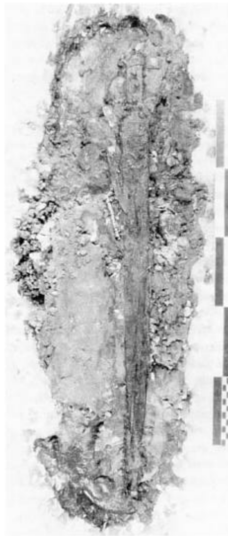
Fig. 4: Paraffinklumpen med indhold. (Ove Madsen foto).

Derimod ses selve sværdet - et 61 cm langt, såkaldt grebtungesværd af bronze. Fæstet er beklædt med træ, som holdes fast af bronzenagler. At dopskoen, som har siddet nederst på skeden, ligger så langt fra sværdspidsen,