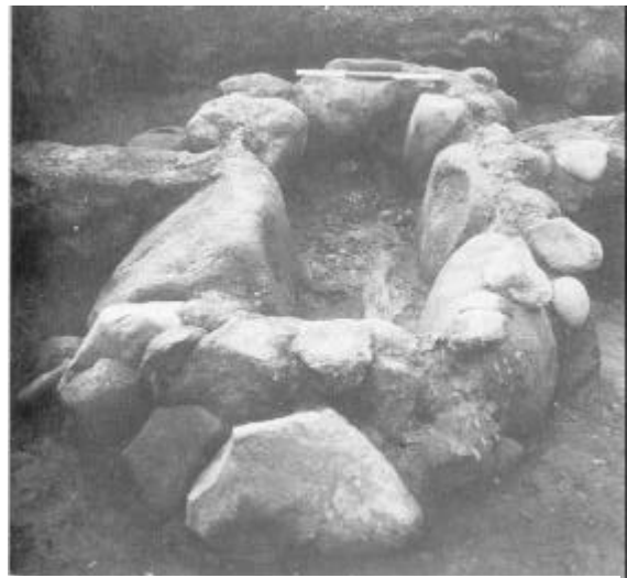
Fig. 2: På udgravningens anden dag – en stor, flot stenkiste. Inden i kisten kan man ane træskeden. (Jens-H. Bech foto).

Han kontaktede straks museet i Thisted, og en arkæolog kom ud og tog stenene i øjesyn. Det var helt klart, at der var tale om dæksten, der havde ligget over en kiste fra oldtiden, og alt tydede på, at indholdet måtte være intakt.