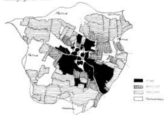
Sundbys jorder 1683

I København var man da heller ikke tilfreds med de jyske markbøger. Få år senere kom skattevæsenets folk igen for at foretage nye taxationer. Resultater foreligger i de såkaldte modelbøger, en for hvert herred. I modelbogen for Morsø Nørre Herred dukker nu overdrevene op, for Sundbys vedkommende ”nogle lyngbakker norden byen med ond græsning”, men fælledele ignorerer fortsat, og der foretages kun ubetydelige justeringer af markbogens tal for hø og høveders græsning.