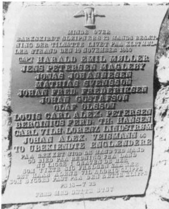
Mindestenen på Klitmøller Kirkegård over de 13 druknede søfolk fra barken ”Sleipner”.