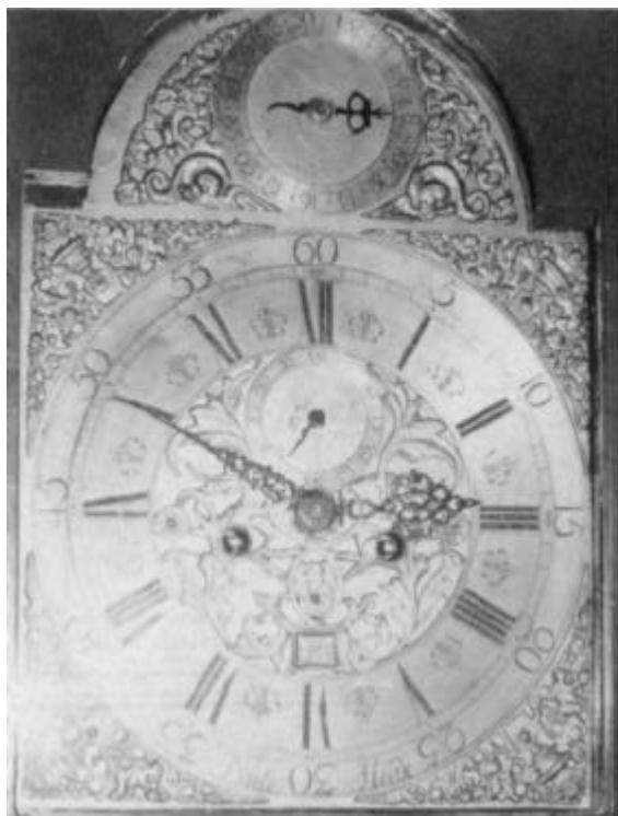
Klokken på Engholm.