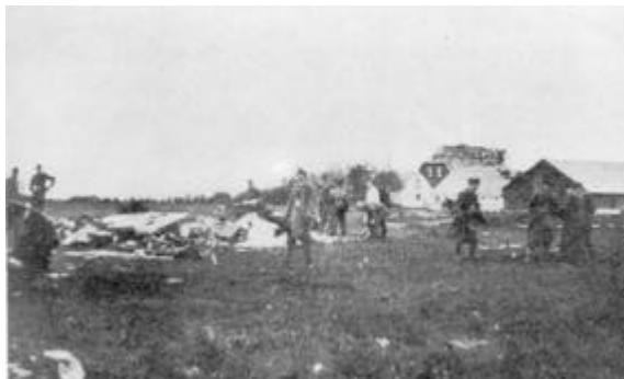
Nedstyrtningsstedet med Kirkegaards ejendom i baggrunden.

Skibe, Fartøjer og Baade af enhver Art indtil videre forbudt. Denne Bekendtgørelse træder i Kraft straks". Tyskerne mente, at Dragsbækbugten var ideel til formålet, idet bakkerne gav læ for vestenvinden, men det forlød senere, at strømforholdene var knap så gode. Den tyske base ved Thisted, kaldet Seefliegerhorst, blev underlagt en tilsvarende, men større, ved Aalborg, og efterhånden som anlægsarbejdet skred frem, begyndte tyske vandfly at dukke op, særlig efter at en betonmole ud i fjorden var færdiggjort. De tyske fly vakte stor opmærksomhed, såvel i som udenfor Thisted. Flyene anvendtes hovedsagelig til recognoscering, i forbindelse med redningsoperationer til søs samt skoleflyvning. Samtidig med anlæggelsen af basen i Dragsbæk blev der anlagt en attrap-flyvehavn i Fårtoft ned mod fjorden. Denne bestod af en stor hangarlignende bygning, og i fjorden ud herfor blev udrangerede fly, hvor al indmaden var fjernet, forankret. Tyskerne håbede på, at dette anlæg, der var ganske ucamoufleret, ville narre engelske flyvere, der måtte dukke op, og forlede dem til at angribe dette i stedet for den egentlige base i Dragsbæk. At disse forventninger blev indfriet tilfulde, fremgår af følgende beretning.