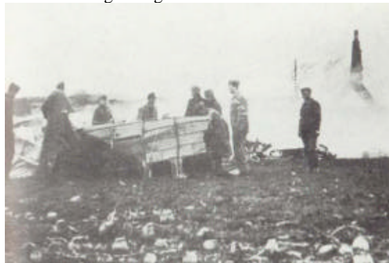
Tyske soldater på nedstyrtningsstedet.