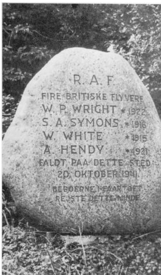
Mindestenen i Fårtoft.

Under den tyske besættelse af Danmark 1940-45 anlagde besættelsesmagten en del nye flyvepladser og udbyggede allerede eksisterende. Den vigtigste var Aalborg lufthavn,