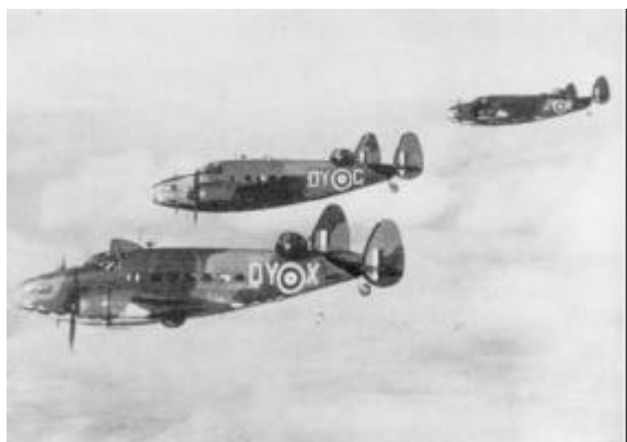
Tre angribende Hudson Mk V fly.

Under den tyske besættelse af Danmark 1940-45 anlagde besættelsesmagten en del nye flyvepladser og udbyggede allerede eksisterende. Den vigtigste var Aalborg lufthavn,