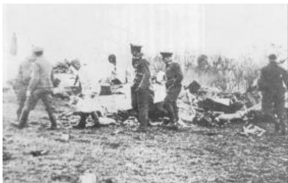
Tyske soldater på nedstyrtningsstedet.

søge ilden bekæmpet og traf yderligere foranstaltninger til at hindre den i at brede sig, hvilket meget let kunne ske i den stærke storm. Hen mod kl. 19.30 kunne såvel brandvæsen som hjælpemandskab returnere til Dragsbæk.