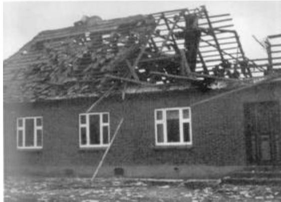
Kirkegaards stærkt beskadigede stuehus.

ringe højde (20-25 meter). Flyenes nationalitet kunne jeg ikke fastslå på grund af afstanden, men antog, at det var tyske fly, der var i færd med at nødlande i det hårde vejr. Da de havde kredset 2-3 gange over havnen, gik de pludselig til angreb fra søsiden. Det forreste fly, der var i lavere højde end de følgende, foretog en skarp drejning mod venstre og styrtede ned, hvorefter jeg så en høj stikflamme og stærk røgudvikling. Næsten samtidig så jeg fly nummer to kaste 2-3 bomber mod de forankrede fly på vandet, medens der tredje tilsyneladende ingen kastede.