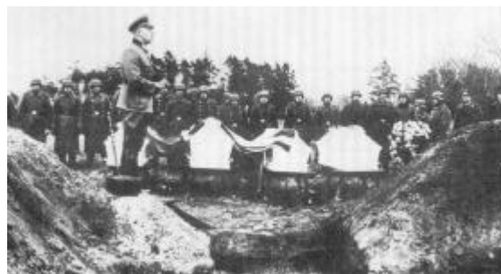
Før jordpåkastelsen. En tysk feltpræst taler ved de fire kister i Frederikshavn.

var dækket af et engelsk flag, et kompagni tyske soldater affyrede en æressalut, og et militærorkester spillede.