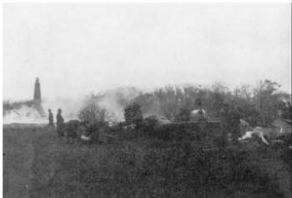
Vragrester fra det eksploderede fly. I baggrunden den nedbrændte ejendom.

i alle retninger ved nedstyrtningen og den efterfølgende eksplosion. En blev fundet ved Kirkegaards stuehus, to andre på marken, hvor flyet havnede. Den fjerde var blevet slynget gennem luften tværs over vejen til Eshøj og var havnet på en mark. Tre af besætningsmedlemmerne var dræbt på stedet, medens den fjerde døde kort efter, alle