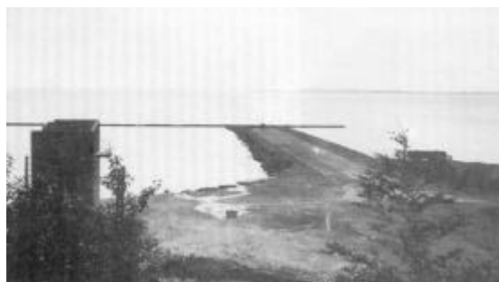
Den tidligere flyvebase i Dragsbæk. Foto: Henning Skov.

1940 påbegyndte det tyske luftvåben anlæggelse af en base for vandfly i Dragsbækbugten ved Thisted, og den 31. august udsendtes fra ministeriet for handel, industri og søfart følgende bekendtgørelse, der var underskrevet af J. Christmas Møller: "I et Omraade i Thisted Bredning beliggende langs Kysten mellem Dragsbæk og