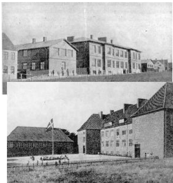
Østre skole, indviet 1921. I udvidet skikkelse anvendt som gymnasium siden 1948.

Indvielsen af den nye Østre skole medførte, at forholdene på skolen i Skolegade kunne forbedres, der blev således mulighed for at indrette lokaler til tegning og naturfag.