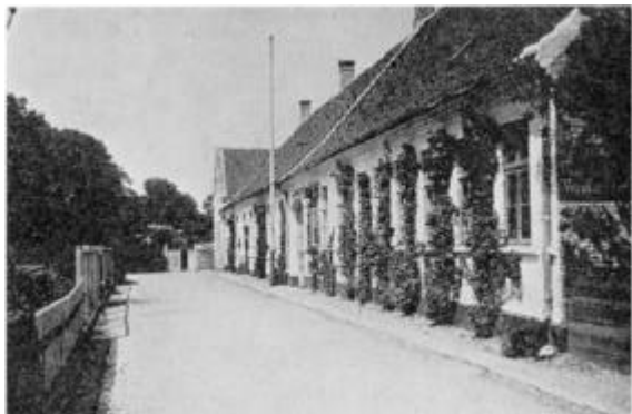
Den gamle realskole på Plantagevej ca. 1890.

Den 16. februar 1856 vedtog rigsdagen ”Lov om en realskole i Thisted”. Loven var blevet fremsat af kammerråd C. A. H. Hansen, der var folketingsmand for Thisted amts 2. valgkreds. Økonomien klarede ved et tilskud fra kommunen og amtet på tilsammen 1000 rigsdalere, hertil kom så et beløb af tilsvarende størrelse, der skulle udredes af Sorø Akademis midler. Disse beløb skulle være tilstrækkelige til at klare de årlige udgifter.