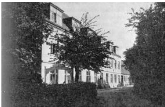
Realskolen efter ombygningen i forbindelse med branden 1924.

Skolen havde straks stor søgning, forøget støtte fra stat, amt og kommune gjorde, at man blev i stand til at oprette flere klasser, herved var klassetallet i 1857 øget til 5 mod de oprindelige 3. Væksten i elevtallet fortsatte stadig, og allerede i 1863 måtte man foretage en udvidelse af skolebygningen. Herved forøgedes de oprindelige 4 klasseværelser med: et klasseværelse, et lærerværelse, et særlokale til naturhistorie- og naturlæreundervisning samt en gymnastiksal. Endelig omdannedes et tidligere særlokale til naturfag til biblioteksværelse.