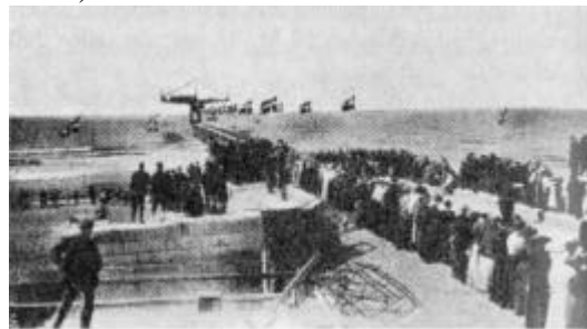
Fra kongebesøget 1908

Allerede så tidligt som i 1892 blev der, som før omtalt, ansøgt om en læmole. Selv om andre pladser også var inde i billedet for placering, blev det ikke blot Vorupør, men også Hanstholm, der hver fik sin mole, og hertil knytter der sig for Vorupørs vedkommende et kongebesøg. I 1908 var kong Frederik den 8. og hans gemalinde, dronning Louise, på en større Jyllandsrejse ledsaget af daværende konseilspræsident J. C. Christensen. Kongeparret havde ønsket at se den endnu ikke færdigbyggede mole og blev understøttet heri af J. C. Christensen (eller måske var det omvendt!).