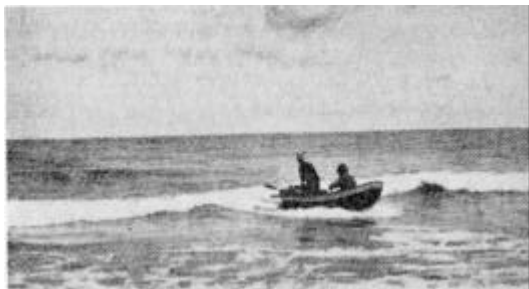
En tomandspram lander - således foregik det første fiskeri fra Vorupør.

Ansøgningen havde som underskrivere: Bestyrelsen for Vorupør Fiskeriforening. Bestyrelsen for Klitmøller og Vangsaa Fiskeriforening.