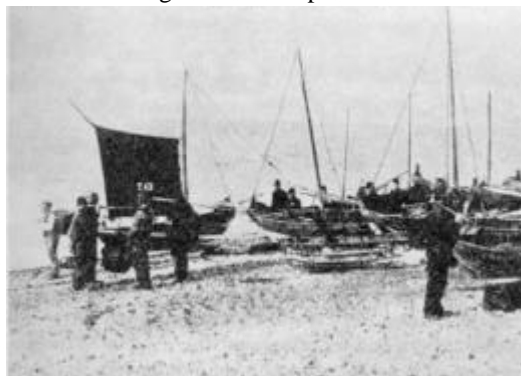
Fra Vorupør strand ca. 1890.