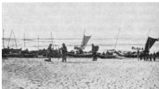
Landingspladsen ved Vorupør 1890 før motorbådene endnu var taget i brug.

Molen ansøgte Munk-Poulsen om den 1. august 1892. Ansøgningen var stilet til indenrigsministeren og så velfunderet med kendsgerninger om, at dersom man fik en sådan mole, ville de årlige fiskedage gå op, så større indtægter blev følgen, ligesom fiskerne, der gik 4-5 mil ud fra kysten for at få bedre fangst, ikke behøvede at forlade redskaber i tilfælde af opdukkende vind og strøm, men kunne tage farer mere med ro, hvis der lå en læmole velegnet til beskyttelse under landinger.