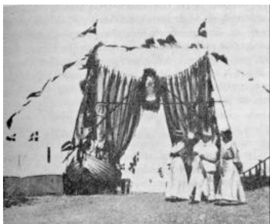
Fra kongebesøget 1908. Æresport.

Jo vist var da de Vorupørfiskere stolte over kongebesøget, hvad følgende tildragelse også understreger. - - -