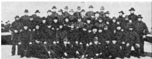
Fiskecompagniets mænd omkring året 1890. Fra venstre til højre ses siddende foran: Bådebygger Kr.

Vorupør skole den 1. januar 1888, og det kan tilføjes, at han ikke tøvede med at bringe det, der i hans unge år havde været en vision, ud i livet. Den unge lærer påvirkede de kammerater, han selv før havde siddet på toften sammen med. Han samlede dem til aftenskole for at lære dem og udvide deres horisont. Derefter blev han sjælen i oprettelsen af Fiskercompagniet, der betød, at der blev