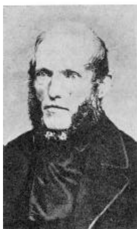
Billede nr. 1

Nu findes der på Thisted museum to fotografier, udført af Carl Bech, Østergade 7, Odense, i størrelsen 5,5 x 9 cm (billede nr. 1), og et fotografi uden nærmere oplysninger i samme størrelse (billede nr. 2). På begge billeder er klædedragtens folder og kroppens og hovedets stilling ens, men der er visse forskelle i ansigtet. Håret på issen er meget lyst på nr. 1, men det er mørkt på nr. 2. Øjnene er også lyse på nr. 1 og mørke på nr. 2, og de har et noget forskelligt udtryk. Desuden er der mere med på nr. 1 end på nr. 2.