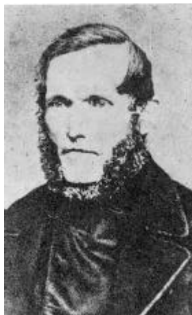
Billede nr. 2

Disse forskelle tyder på, at nr. 1 er et originalt billede, og nr. 2 en retoucheret udgave af det. Hvis nr. 2 var det originale, ville der nemlig ikke være nogen grund til at gøre hår og øjne lysere, mens man nok kan se en vis mening i at gøre dem mørkere, hvis billede nr. 1 skulle affotograferes. Det næsten farveløse hår og de meget lyse øjne virker nemlig noget uharmonisk i sammenligning med de øvrige toner i billedet. Dertil kommer så, at på det ældste af de her gengivne litografier (billede nr. 3) er håret på Kolds isse også meget lyst. Det må altså snarest have haft nr. 1 som forbillede, og man må vel så på den tid have ment, at dette fotografi var originalt. Fotografen, Carl Adolph Bech, var samtidig med Kold og døde i Odense 1872 kun to år efter Kold, 52 år gammel 1 ). Det må også derfor antages, at fotografiet, billede nr. 1, er originalt. På nr. 2 har man da med vilje gjort hår og øjne mørkere, og derved er man så kommet til at ændre øjnenes udtryk. Det kan ses, at pupillerne er gjort større og ved den ene side når næsten til regnbuehindens ydre kant, hvad der er ganske unormalt.