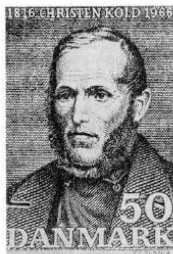
Billede nr. 6. Frimærke. Skåret af Czeslaw Slania.

Sammenligner man nu billederne, falder det straks i øjnene, at ansigterne er så forskellige på trods af, at de ændringer, der er foretaget, synes at være små. Hvis man lægger det ældste fotografi (nr. 1) ved siden af det yngste litografi (nr. 4), siger de fleste: "Jamen, det er jo ikke den samme mand!"