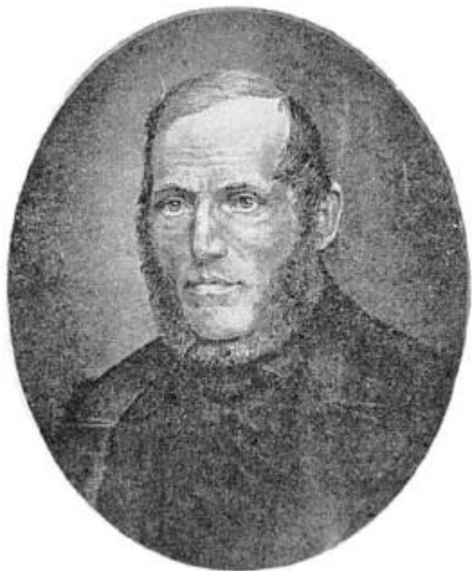
Billede nr. 4. Den rare Kold, den gode Kold.