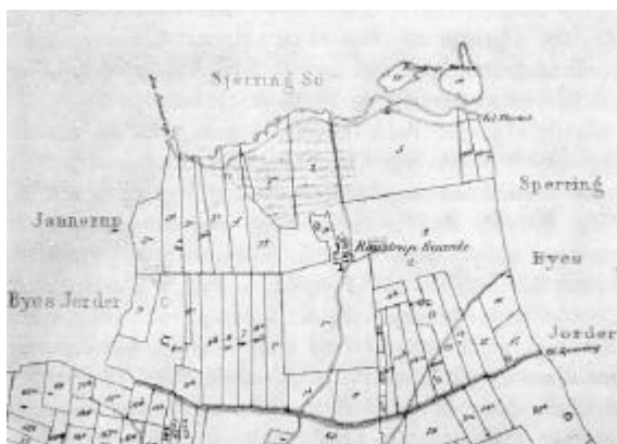
Råstrup og Råstrup mark ca. 1850 efter minoreret matrikelkort 1:20.000