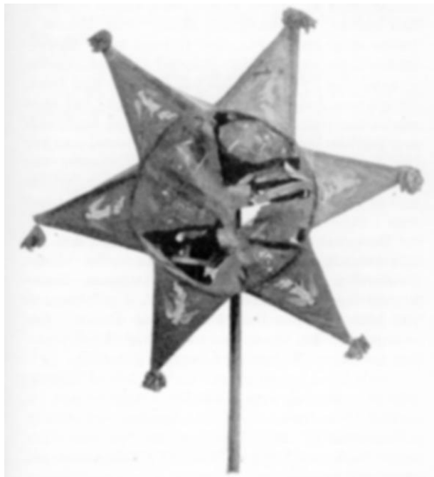
Helligtrekongerstjerne i Morslands Museum i Nykøbing.

De hellige tre Konger saa hjertensglad, og Dejlig er den Himmel blaa.