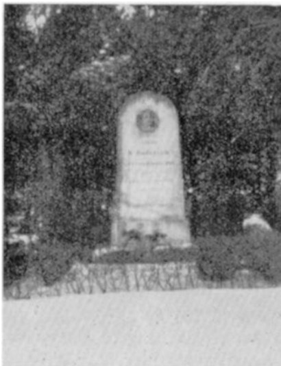
Mindesmærket for Etatsraad N. Andersen i Ydby Plantage

Til Fødesognet Ydby skænkede han den ca. 10 Tdr. Land store Ydby Plantage, der ligger paa et Højdedrag med vid Udsigt og frembyder flere interessante Partier. Paa Plantagens Festplads rejstes 1903 en Mindesten over Sognets store Søn med en Portrætmedaillon af Etatsraaden.