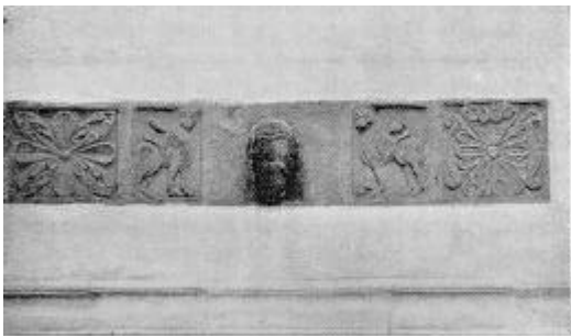
Middelalderlige Figursten i Kirkens Østgavl.

Gennem de c. 400 År Kirkebygningen har stået, har den været underkastet flere Tilbygninger. Den består nu af Tårn og Hovedskib med Sideskib mod Nord og to Fløje henholdsvis til Våbenhus og Sakristi. Hele Kirkens Længde er c. 36 Meter og Tårnets Højde til Fløjknappen c. 40 Meter.