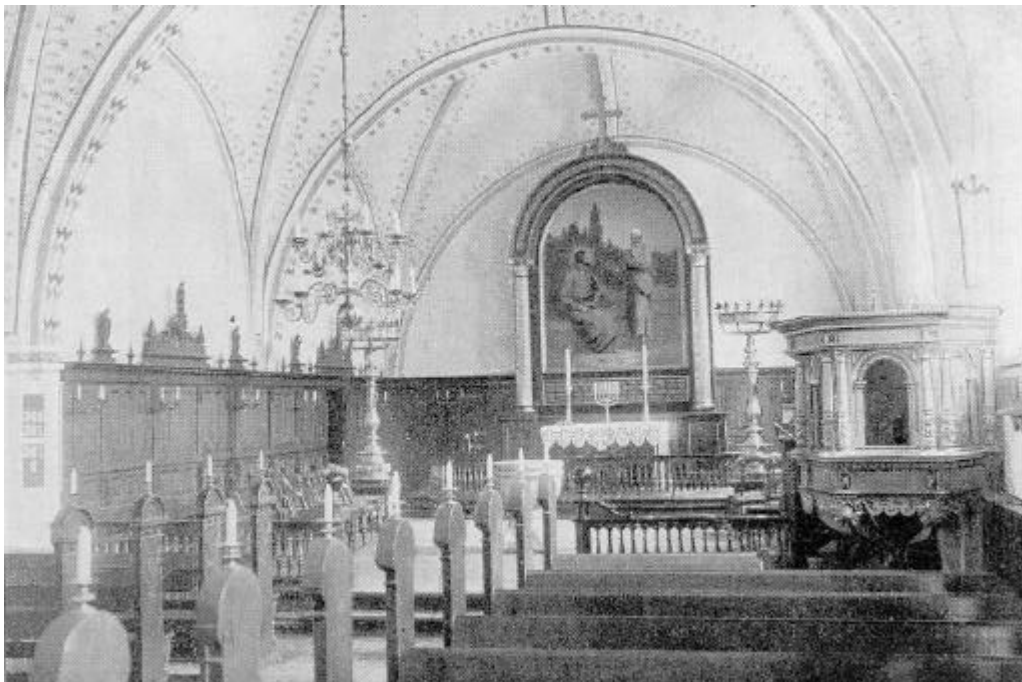
Koret i Thisted Kirke.